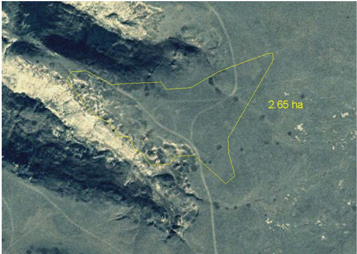
Figure 3. Aire de répartition du yucca glauque au site de Pinhorn.