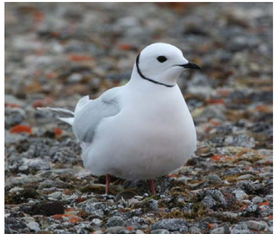
Figure 1. Mouette rosée ( Rhodostethia rosea ) © Sa Majesté la Reine du chef du Canada (Mark Mallory, Environnement Canada).

Le nid peut-être une cavité dans le sol ou un amas de mousse en forme de coupe, ou il peut être situé dans des touffes de carex (Chartier et Cooke, 1980; Macey, 1981). Les œufs de la Mouette rosée sont de couleur olive marquée de taches d'un roux pâle (Ehrlich et al. , 1988). Ils mesurent environ 30 mm sur 43-46 mm (Béchet et al. , 2000). La couvée compte en général trois œufs, mais elle peut aussi contenir un ou deux œufs. Les deux parents participent à l'incubation (Macey, 1981) qui dure de 21 à 22 jours. Les oisillons effectuent leur premier vol environ 20 jours après l'éclosion (Chartier et Cooke, 1980; Ehrlich et al. , 1988). Au Canada, l'éclosion a lieu vers la mi-juillet (Macey, 1981).