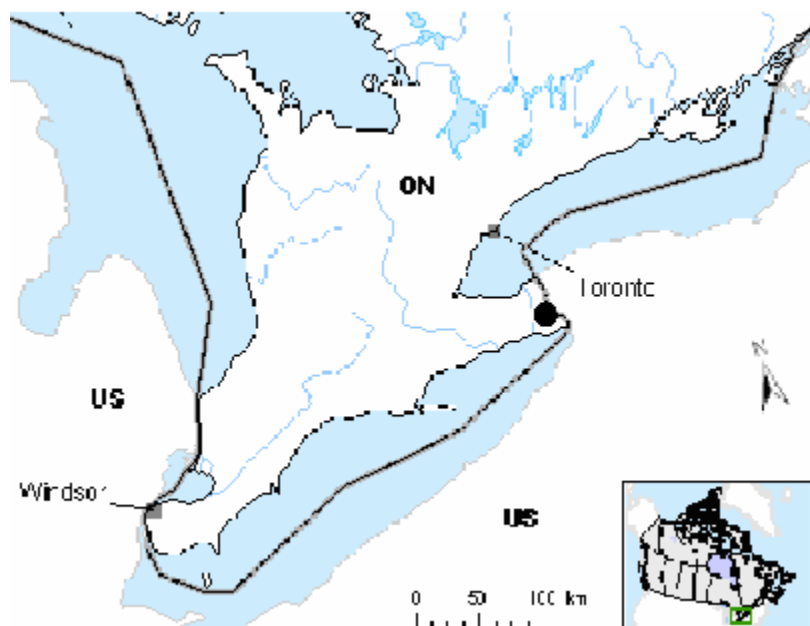
Figure 1 : Emplacement approximatif de la seule occurrence historique du ptychomitre à feuilles incurvées ( Ptychomitrium incurvum ) au Canada