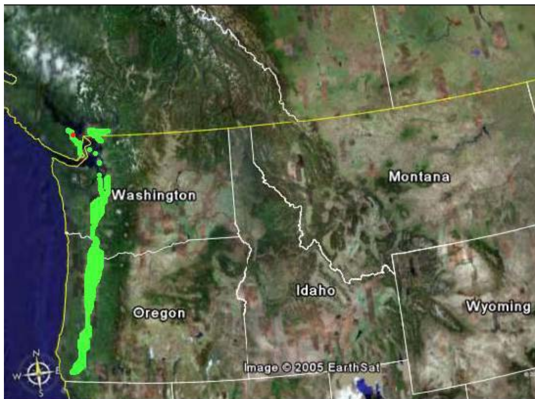
Figure 2. Aire de reproduction du Bruant vespéral de la sous-espèce affinis , montrée en vert pâle; le point rouge indique le site de l'aéroport de Nanaimo. La sous-espèce intérieure du Bruant vespéral ( P. g. confinis ) se reproduit dans les zones de prairies indiquées dans l'image satellite en chamois, celles-ci sont séparées des prairies côtières par de hautes montagnes (vert foncé et blanc).

Aujourd'hui, au Canada, on sait que la sous-espèce affinis se reproduit sur l'île de Vancouver à un seul emplacement : l'aéroport de Nanaimo, situé près de Cassidy (Beauchesne, 2002a, 2003, 2004a). Dans le passé, elle a été signalée durant la saison de reproduction sur l'île de Vancouver, de l'estuaire de la rivière Englishman dans le nord, jusqu'à Cobble Meadows et Mill Bay vers le sud. La sous-espèce était également un reproducteur local dans les basses terres du Fraser situées sur la côte sud-ouest du continent, en Colombie-Britannique. La dernière mention de reproduction confirmée pour cette région date de 1968 (Campbell et al. , 2001). La taille historique de la population est inconnue, mais il est probable que la sous-espèce n'a jamais été commune au Canada car elle n'a jamais été signalée en grands nombres ou à plus que quelques emplacements.