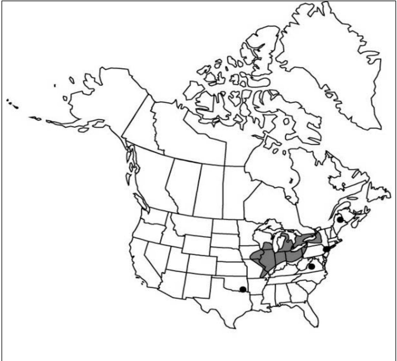
Figure 1. Aire de répartition mondiale actuelle de la platanthère blanchâtre de l'Est

À l'échelle mondiale, la platanthère blanchâtre de l'Est a été observée dans une seule province canadienne et dans 13 États aux États-Unis (figure 1). L'aire de répartition de l'espèce est centrée dans la région des Grands Lac et s'étend vers l'ouest jusqu'en Iowa, vers le sud jusqu'en Illinois, en Indiana et en Ohio, vers l'est jusqu'en Virginie et vers le nord jusqu'en Ontario. Une population isolée est établie au Maine (COSEPAC, 2003; U.S. Fish and Wildlife Service, 1999.)