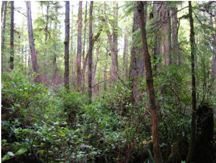
Figure 3. Peuplement ancien de thuya géant et de pruche de l'Ouest, sur des terres de la Couronne provinciales situées à l'intérieur des terres par rapport à la réserve de parc national Pacific Rim. La région qui entoure le parc fait l'objet d'une intense exploitation forestière, et les parcelles vestigiales de la forêt ancienne constituent des refuges importants pour la limace-sauteuse dromadaire.

Les microhabitats favorables confèrent à la limace-sauteuse dromadaire une protection contre les fluctuations quotidiennes ou saisonnières de température et d'humidité (tel que résumé dans Prior, 1985). L'humidité du sol et la capacité de la végétation du sous-étage de conserver l'humidité et de procurer des abris convenables contribuent à protéger l'espèce durant les périodes de sécheresse et de faible humidité relative (nombreuses études résumées dans Prior, 1985).