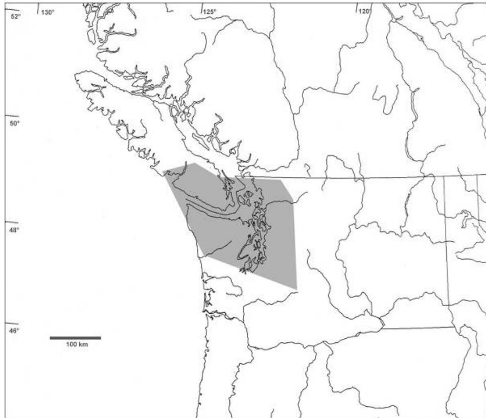
Figure 1. Répartition mondiale de la limace-sauteuse dromadaire, selon Branson (1972, 1977, 1980) et d'après les emplacements canadiens de l'espèce connus en 2008.

Au Canada, l'aire de répartition de la limace-sauteuse dromadaire se limite à une région d'environ 4 000 km 2 dans le sud de l'île de Vancouver (Colombie-Britannique). On ne dispose d'aucune donnée historique sur l'espèce, puisqu'elle a été décrite récemment par Branson (1972) et que la première mention confirmée en Colombie-Britannique remonte à 1999 (K. Ovaska, comm. pers., 2008). Il existe toutefois une ancienne mention faisant état de la présence d'une grande limace-sauteuse dans l'île de Vancouver (Hanham, 1926). Cette mention se rapporte vraisemblablement à la limace-sauteuse dromadaire (COSEPAC, 2003).