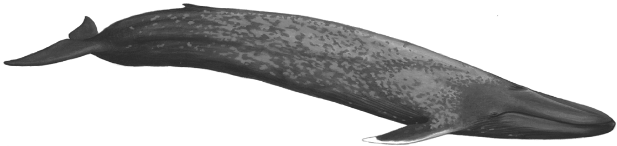
Figure 1. Rorqual bleu – Illustration de Daniel Grenier, courtoisie de la Station de recherche des îles Mingan.

Le rorqual bleu est le plus gros animal qui ait jamais vécu sur la Terre. Son poids varie entre 73 000 et 136 000 kg (Sears, 2002; Sears et Calambokidis, 2002). Les femelles sont généralement plus grosses et plus longues que les mâles et les individus sont plus gros dans l'hémisphère Sud que dans l'hémisphère Nord (Lockyer, 1984; Yochem et Leatherwood, 1985).