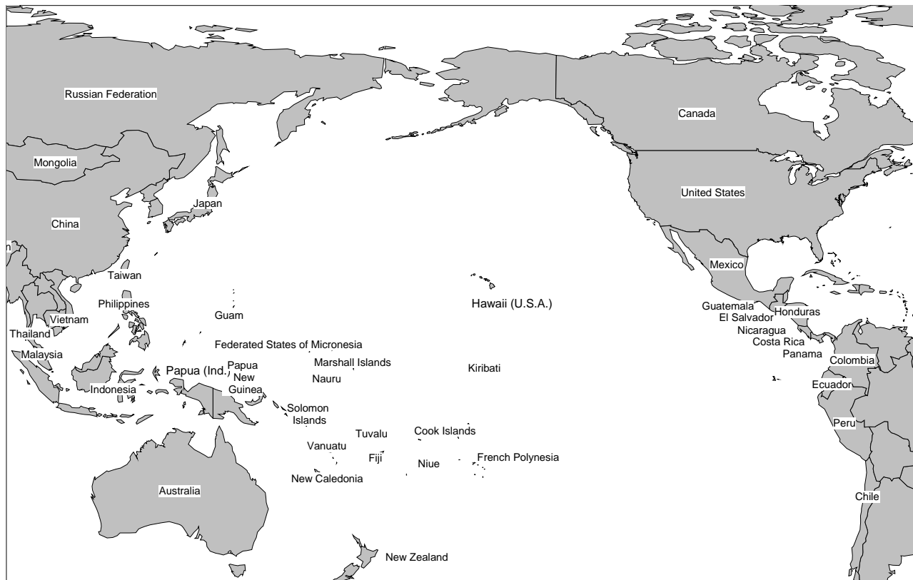
Figure 1. L'océan Pacifique et les noms d'endroits mentionnés dans le texte.

La tortue luth adulte n'est pas seulement la championne toute catégorie des migrations mais elle revendique également le titre de posséder la plus grande aire de répartition (Pritchard and Trebbau 1984). On la retrouve dans les eaux tropicales et les eaux tempérées de l'Atlantique et du Pacifique et dans l'océan Indien. (Gulliksen 1990; Ernst and Barbour 1989). Les adultes nagent sur plus de 15 000 km par année à la recherche de nourriture et, comme c'est le cas des luths qui fréquentent les eaux de la Colombie-Britannique, elles peuvent traverser les océans de part en part (Eckert 2002b). En plus des principaux sites de nidification du Pacifique, du Mexique, du Costa Rica, de Papouasie, de Papouasie-Nouvelle-Guinée, des Îles Salomon et de la Malaisie (James 2001), d'autres lieux de nidification sont éparpillés en Amérique centrale et dans les secteurs insulaires de l'Ouest autour des Îles Salomon, du Vanuatu, des îles Fidji ainsi qu'en Australie (NMFS et USFWS 1998). Se reporter à la Figure 1